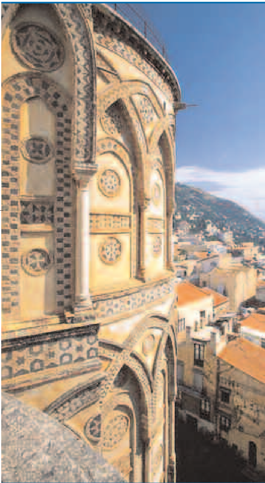
Palermo - Monreale